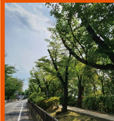
台風の影響で折れた樹木の伐採(災害対策) [学校付近の毛長川沿道]