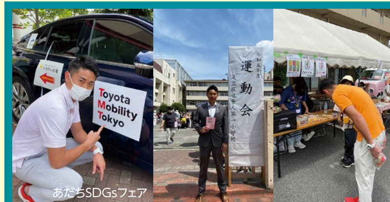
足立区主催の様々なイベントへ!!