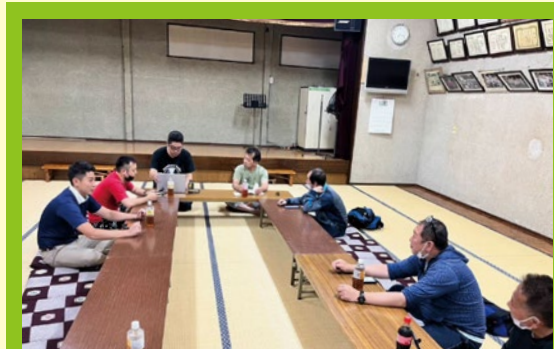
地元の舎人町会青年部活動!