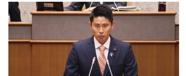
▲第2回定例会での一般質問の様子