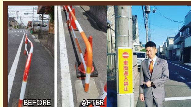
舎人地域の通学路におけるガードレール整備、 一方通行における注意喚起!