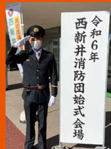
令和6年 西新井消防団始式