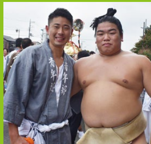
地元の舎人氷川神社大祭