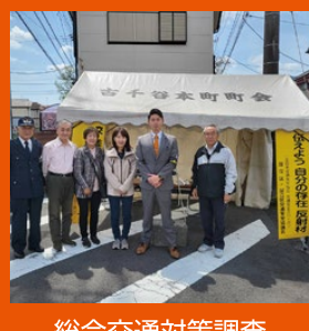
総合交通対策調査 特別委員会委員長として 各地域のテント訪問