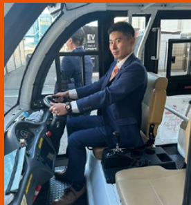
葛飾区グリーン スローモビリティの視察