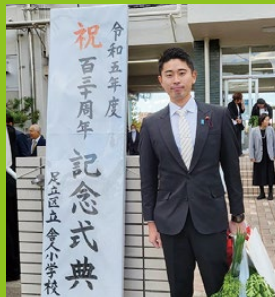
舎人小学校 創立130周年