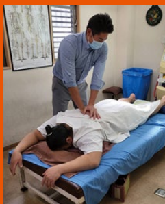
整骨院の経験が健康 政策に役立っています