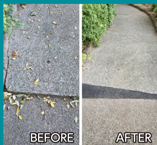
見沼代親水公園内の 歩道整備