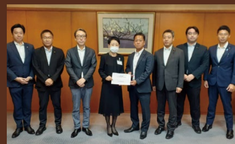
政調副会長として区長へ 各種団体予算要望書提出