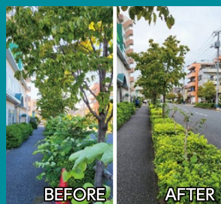
入谷地域において歩道整備