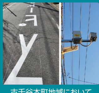
古千谷本町地域において 注意喚起の標識道路整備、 通学路における防犯カメラを設置