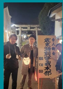
恒例の歳末警戒 (夜警)