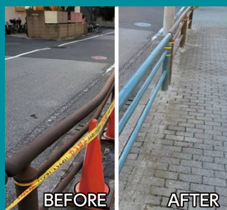
舎人地域における ガードレール整備