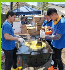
文化市、さくら祭りでの 青年部員として焼きそば