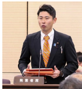
令和6年第1回定例会での一般質問の様子