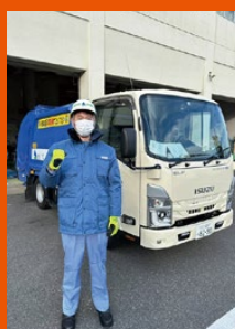
足立清掃事業 体験