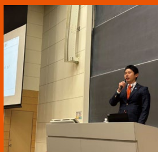
卒業した帝京平成大学 において講師を!